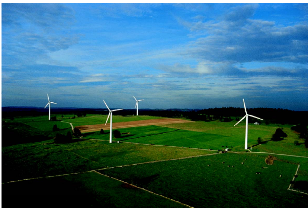
Parc de Mont-Crosin (avec 4 éoliennes)

D'un point de vue suisse, l'exploitation de l'énergie éolienne, comme le confirme le développement réjouissant de JUVENT SA depuis 10 ans, correspond à une demande du marché, même modeste. Elle mérite donc sa place en tant qu'énergie complémentaire parmi les différents types d'électricité disponibles dans notre pays. La demande en électricité éolienne de JUVENT SA, qui n'est pas soutenue par des subventions publiques à moyen terme, est considérée comme durable.