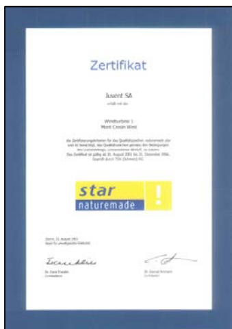
Label de qualité JUVENT SA : la certification naturemade star

L'importation massive de courant éolien pose d'autres difficultés, d'ordre technique pour l'essentiel. Ainsi, aujourd'hui, le réseau du Nord de l'Allemagne peut être congestionné lors des pics de production d'électricité éolienne. Des importations massives risqueraient de provoquer d'autres problèmes. Il faudrait de plus mobiliser les capacités de réserve nécessaire en Suisse afin de garantir la sécurité d'approvisionnement lors des inévitables périodes de vents faibles. Tout cela se répercuterait naturellement en termes de coûts. Difficile dans ces conditions de vanter les mérites d'une énergie moins chère !