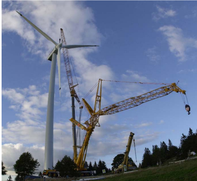
Automne 2004 : les deux plus importants camions-grues de Suisse installent la 8 e éolienne de JUVENT SA à Mont-Soleil

annuelle de près de 3 000 foyers – sont produits chaque année, ce qui représente environ 90 % du courant éolien d'origine suisse.