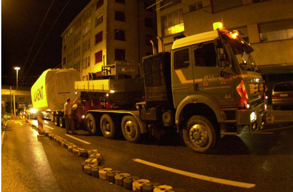
Des convois spéciaux impressionnants